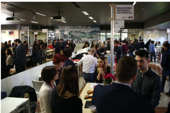
Tanti gli studenti che hanno chiesto informazioni ai desk allestiti per il Career Day dell'Università Statale