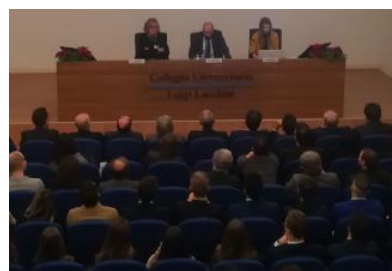
La presentazione dell'associazione nell'auditorium del Collegio Lucchini

Universitario di Brescia. Oltre a fare da collegamento tra gli studenti e dottorandi ospiti nella struttura e il mondo universitario l'Associazione Alumni si prefigge il ruolo di mantenere saldi legami con il Collegio e di alimentare la rete di contatti tra gli Associati; di promuovere iniziative volte ad orientare l'inserimento degli Alumni neolaureati nei diversi settori della vita culturale, professionale e della ricerca scientifica e di favorire la solidarietà, lo sviluppo, la conoscenza e lo scambio tra i soci. Ma non solo, la